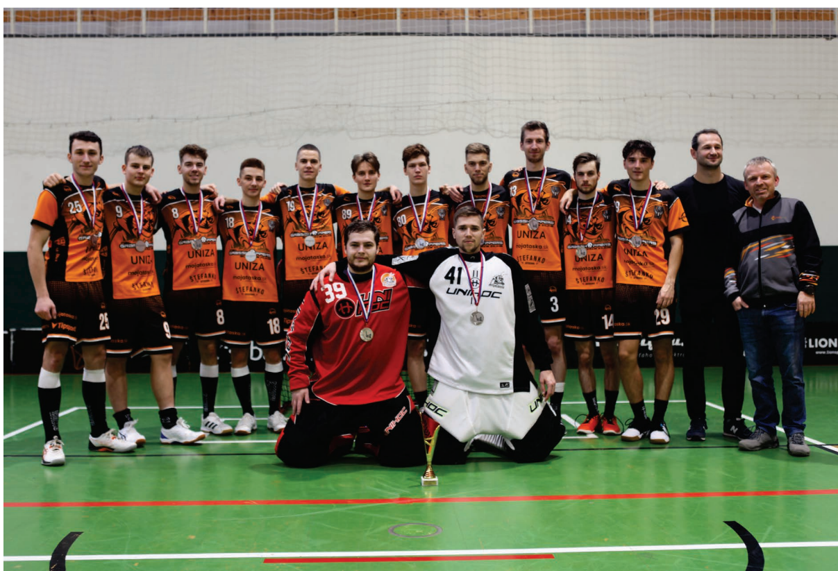
Obr. č. 1 Strieborný tím florbalistov UNIZA

V dňoch 22. – 23.11.2023 sa v športovej hale na Rosinskej ceste v Žiline uskutočnilo Finále univerzít SR 2023 vo florbale. Jeho organizátormi boli Ústav telesnej výchovy UNIZA, športový klub AC UNIZA a SAUŠ. Podujatia sa zúčastnili štyri najlepšie univerzity jednotlivých regiónov, a to Žilinská univerzita v Žiline, UK Bratislava, TU Košice a SPU Nitra. Víťazom Finále univerzít SR 2023 vo florbale sa stal tím UK Bratislava. Florbalisti Žilinskej univerzity v Žiline obsadili po samostatných nájazdoch konečné 2. miesto.