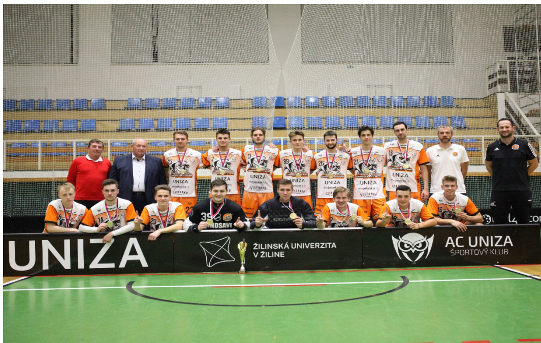
Obr. č. 1 Víťazný florbalový tím UNIZA

UPJŠ Košice bola poverená Slovenskou asociáciou univerzitného športu usporiadať celoslovenské Finále univerzít 2021 v basketbale mužov a žien. Víťazom turnaja mužov sa stal tím UK Bratislava. Žilinskí basketbalisti obsadili konečnú bronzovú priečku, keď sa im v rozhodujúcom zápase nepodarilo zdolať domácich Košičanov.