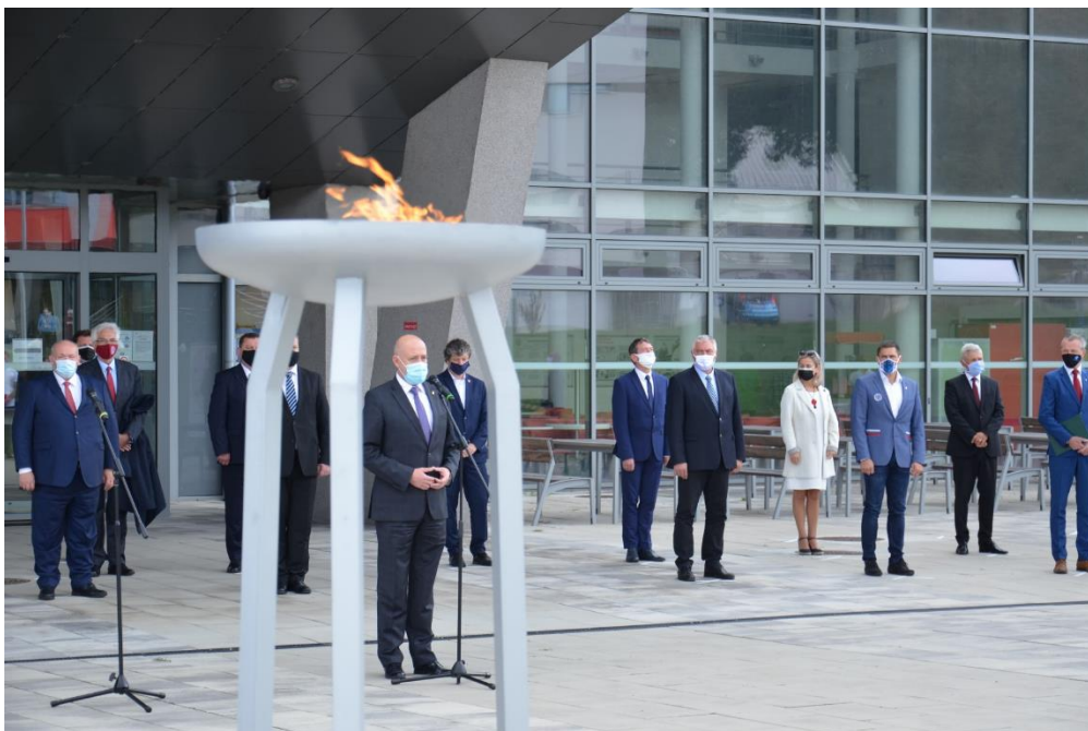
Obr. č. 1 Otvárací ceremoniál LU SR 2020

otvárací ceremoniál LU SR 2020 sa konal 5. októbra 2020 na Univerzitnom námestí Žilinskej univerzity v Žiline a zapálením univerziádneho ohňa sa odštartovali športové súťaže .