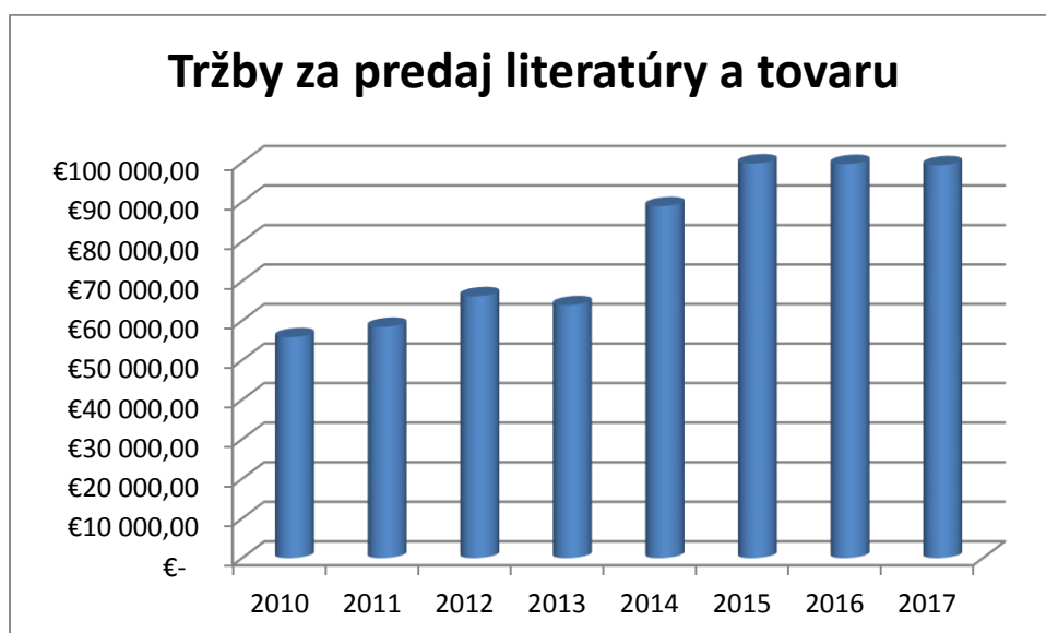
Graf č. 1

Nákup publikácií je možné realizovať aj objednávkou prostredníctvom e-shopu ( www.edis.uniza.sk ), či už osobným prebratím alebo na dobierku.