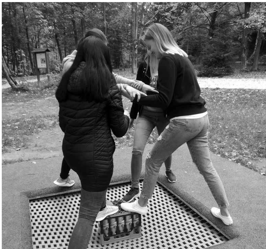
Teambuildingové aktivity študentov

Som veľmi rád, že vzniklo toto centrum, pretože predtým chodili za mnou študenti sami od seba – teda tí, ktorí ma poznali. Teraz môžu prísť aj tí, ktorí si nás nájdu na stránke, čo je veľmi dobre, lebo im to môže pomôcť