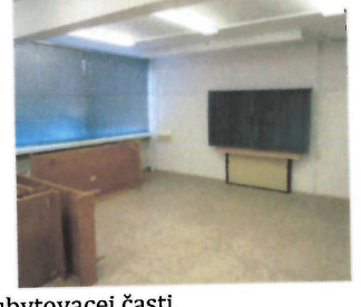
Hlavné schodisko, spojovacia chodba s objektom kuchyne č.s.5049, učebňa - 1.NP ubytovacej časti