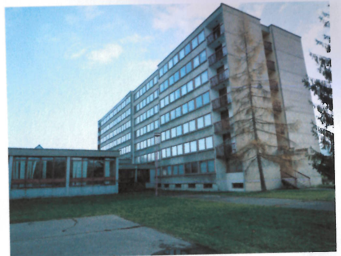
Ubytovňa č.s. 1920 na parc. KN č. 7020/2, k.ú. Ružomberok - JZ a SZ pohľad