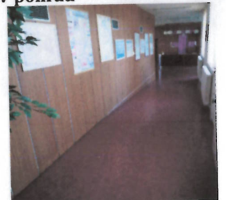
Prízemná časť objektu - hlavný vstup s vrátnicou, spoločenskou miestnosťou a spojovacou chodbou s ubytovacou časťou