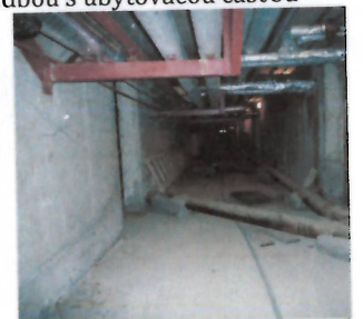
Vnútročné priestory v 1.PP ubytovacej časti - výmeniková stanica, dielňa a podzemný kolektor s rozvodmi